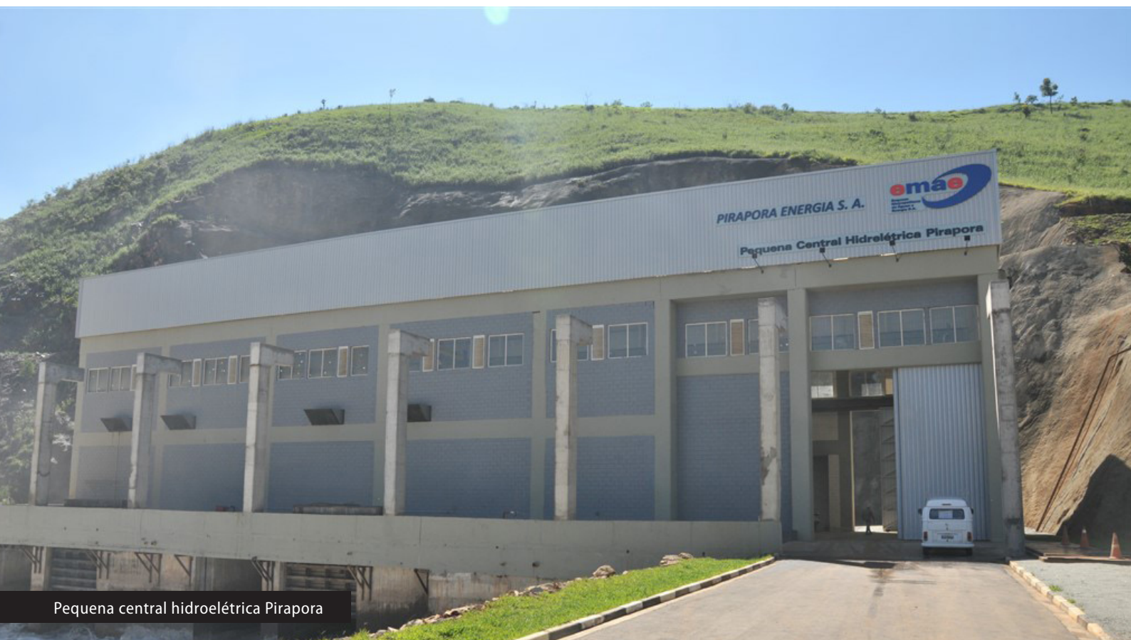
Pequena central hidroelétrica Pirapora